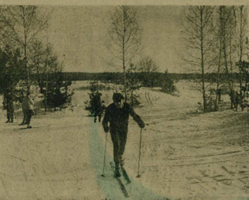
В выходной день...