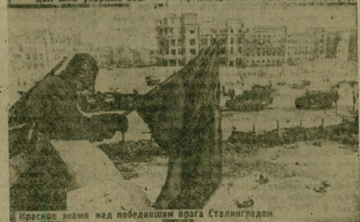
За каждую улицу, за каждый дом шли упорные бои. Артиллеристы в боях за Сталинград. Красное знамя над побежденным врагом Сталинградом.