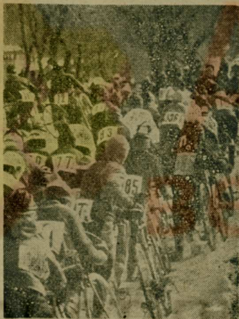
третье, второе место — у спортклуба «Старт» из Краснозаводска.