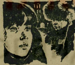
Кто стучится в дверь мое имя...

На экраны кинотеатров в Дом культуры Люберецкого района выходит новый художественный фильм «Кто стучится в дверь мое имя» режиссера Н. Сквйбина (автор сценария Т. Хлопникина), снятый на киностудии «Мосфильм».