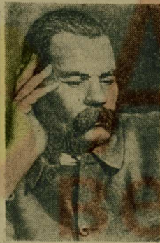
чество освобожденного труда, воспитанного революцией Человечества.

В книгах послеоктябрьских лет он славил раскрепощенную созидательную силу людей, историческое творчество свободного народа, гордое могу-