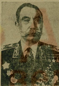
НА СНИМКЕ: С. М. Буденный.

дал для дальнейшего укрепления Советских Вооруженных Сил. С первых дней Великой Отечественной войны С. М. Буденный отдавал все свои силы организации отпора немецко-фашистским захватчикам. В послевоенные годы Буденный участвует в борьбе за мир и дружбу между народами, укрепление интернациональных связей СССР.