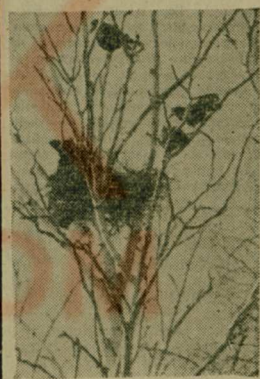
Писк и голос за окном — Расшумелся птичий дом: В нем прибавилось жильцов С появлением пенцов.