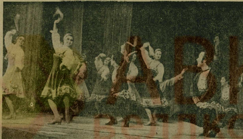
Хореографическому ансамблю «Россия» Люберецкого Дворца культуры в этом году исполнилось 20 лет. Тысячи концертов для народного коллектива за эти годы в нашем районе, Москве, гастролировал в СССР и за рубежом.

В. ЗАДОРНОВ, инструктор Люберецкого городского спорткомитета.