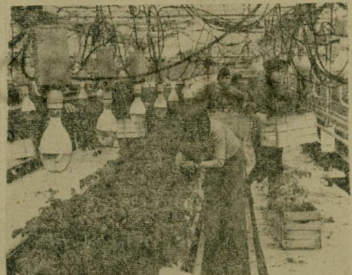
Профессионально-техническое училище, расположенное на территории совхоза «Марфино», имеет свою учебно-производственную базу. Здесь учащиеся получают навыки работы в теплицах, у квалифицированных растениеводов перенимают опыт получения высоких урожаев различных овощей.