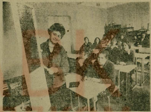
Программный материал легче усваивается учащимися в кабинетах, оборудованных с учетом требований научной организации учебного процесса.

Проезд: от ст. метро «Щербаковская», далее тролл. 9, автобусы 76, 85 до остановки «Кашенкин луг» (около Останкинского телецентра).