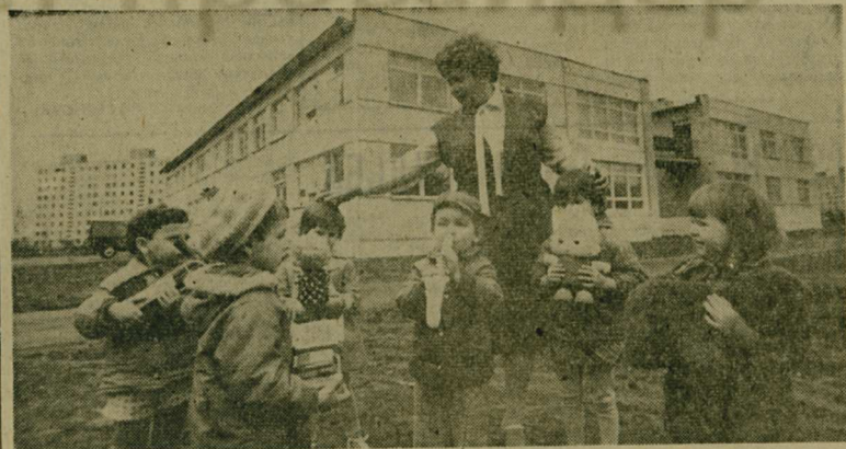
Под мирным небом Родины растут наши дети — внуки ветеранов войны. Заботясь о них, государство строит ясли, детские сады, школы... Детский сад № 53 в Люберецке, на Красной горке, сдан год назад. Сейчас его посещают около 200 ребят.