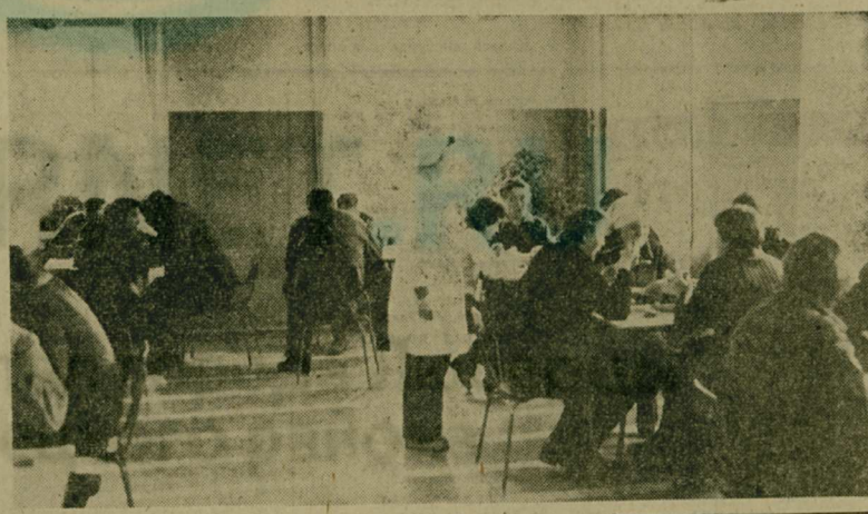
В разгаре полевые работы в совхозе имени Моссовета. Это и возование картофеля, и посадка капусты, сев поздних овощных культур, поля, другие виды ухода за посевами. При таком напряженном трудовом ритме важно хорошо организовать питание рабочих. С большой нагрузкой в эти дни работает