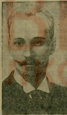
ПЛАМЕННЫЙ революционер-профессионал, верный ученик и соратник В. И. Ленина Николай Эрнстович Бауман принадлежит к славному когорте героев искровской эпохи, которые составили ядро большевистской партии в России.

Он был одним из активных членов Петербургского «Союза борьбы за освобождение рабочего класса», ближайшим помощником В. И. Ленина в создании и распространении первой общерусской политической газеты «Искра». Как агент «Искры», он переправлял транспорты с газетой, ус-