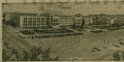
МЕСЯЧНИК ЗАВЕРШЕН. БЛАГОУСТРОЙСТВО ПРОДОЛЖАЕТСЯ