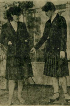
МОСКВА. Специалистами Общесоюзного Дома моделей создана новая школьная форма для девочек. Она имеет два варианта: костюм-тройку и комплект спортивного стиля. НА СНИМКЕ: образцы новой формы.