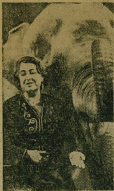
«Забавля — поучать» — эти слова Владимира Леонидовича Дурова — родоначальника известной цирковой династии дрессировщиков — написаны на заневесе знаменитого Театра зверей, носящего его имя. Этот уникальный, единственный в мире театр