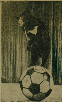
отпраздновал недавно свое семидесятилетие. В театре около трехсот зверей. И не только экзотические представители фауны — слоны, обезьяны, леопарды, карликовые бегемоты, морские лвы, кенгуру, лемуры, но и самые обыкновенные — козы, кошки, медведи, собаки, еноты.

Свято сохраняется в театре так называемая дуровская школа мягкой дрессировки, использующая главным образом вкусовые поощрения.