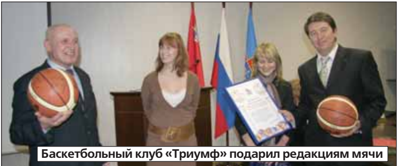
Баскетбольный клуб «Триумф» подарил редакциям мячи

С большим интересом были встречены специальный выпуск «Люберецкой панорамы» - «Нам два года!» - и видеofilmы о работе двух редакций, подготовленные тележурналистами.