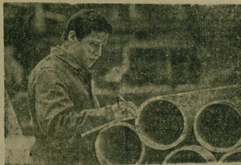
Москва. На передовом предприятии научно-производственного объединения «Пластик» — Дорогомиловском химическом заводе — в ходе реконструкции пушено в эксплуатацию новое производственное отделение, которое стало выпускать поливинилхлоридные трубы различных диаметров. Они находят широкое применение в строительстве. С апреля изготовлено 30 тонн новой продукции, а до конца года будет выпущено более 2200 тонн.

Новая продукция из полимеров заменит металл при изготовлении высокопрочных труб и даст экономию в народном хозяйстве. 1 тонна пластиковых труб заменяет 7 тонн труб из металла.