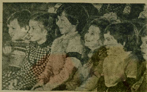
В ТЕАТРЕ НА УЛИЦЕ ДУРОВА

Москва. Воспитан в подрастающем поколении бережное отношение к окружающему нас миру, чуткость, доброту — такова направленность всей работы единственного в мире Театра зверей имени «дедушки Дурова», основателя династии артистов-дрессировщиков, составивших целую эпоху в русском и советском цирковом искусстве. На сцене театра можно увидеть самые необыкновенные содружества животных — волка и козу, лису и петуха, кота и крысу.