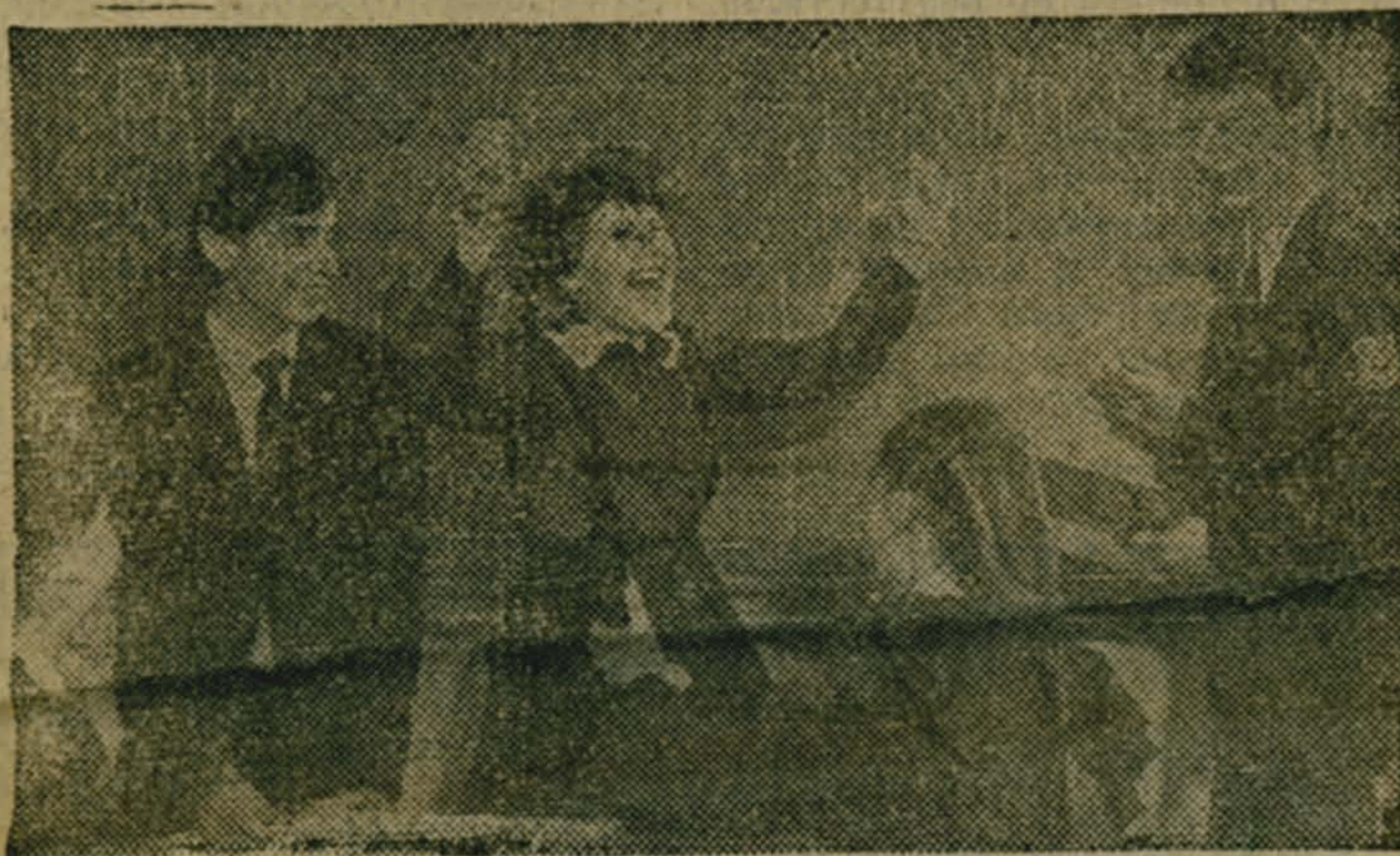
Украинская ССР. Поиски новых путей для использования в системе образования диалога «человек-машина» ведут киевские кибернетики в «совторстве» со школьниками. В средней школе № 132 с помощью специалистов Института кибернетики имени В. М. Глушкова Академии наук Украины создан и действует свой вычислительный центр с ЭВМ и дисплеями. НА СНИМКЕ: «Урал! Задача решена». (Фотохроника ТАСС).