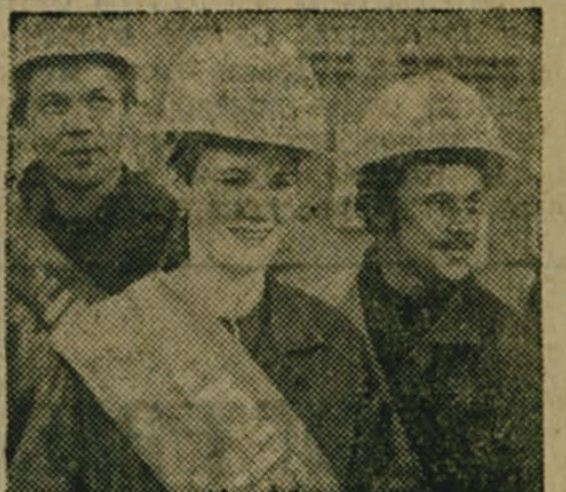
Миллиард кубометров топлива в сутки — такого рубежа добычи газа достигли промысловики Тюмени.