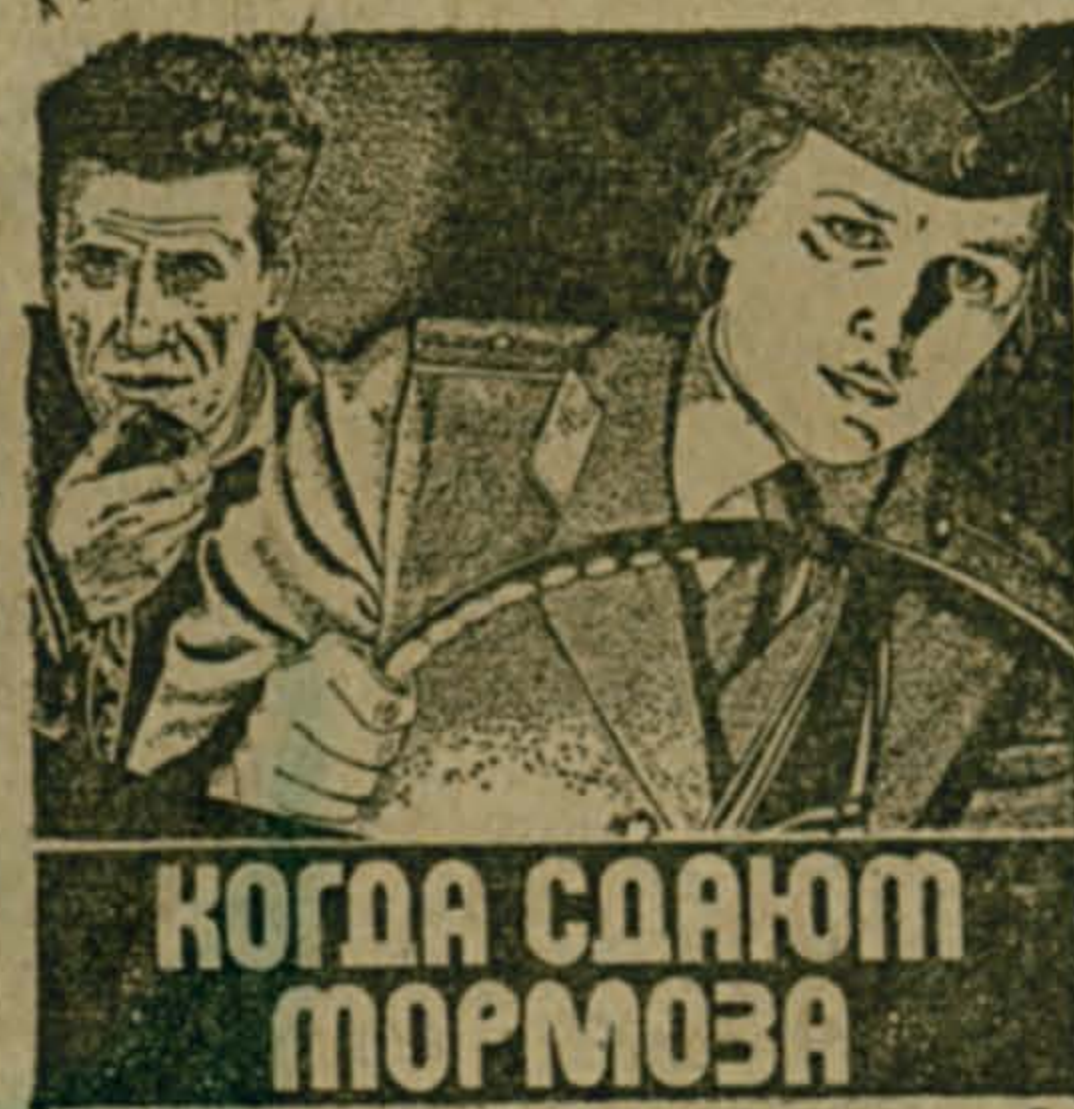
КОГДА СДАЮТ ТОРМОЗА