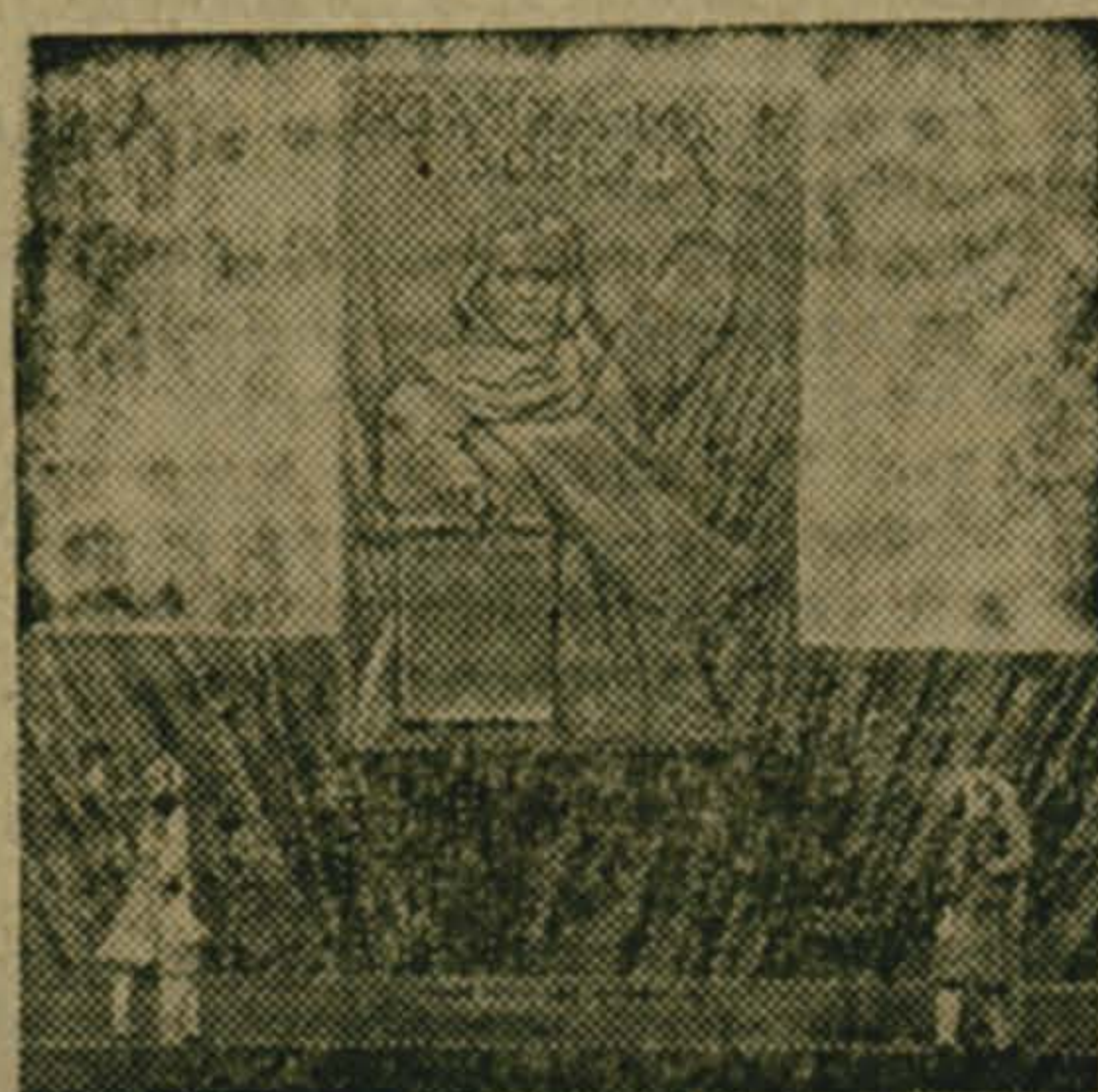
Москва. Памятник Победы увековечит бессмертный подвиг советского народа в Великой Отечественной войне 1941—1945 годов против фашистских захватчиков.

Авторский коллектив художников, участвующих в создании ансамбля, завершил создание рабочей модели центрального монумента Победы. В Москве, на Поклонной горе, где будет расположен мемориал, уже развернута работа по его сооружению.