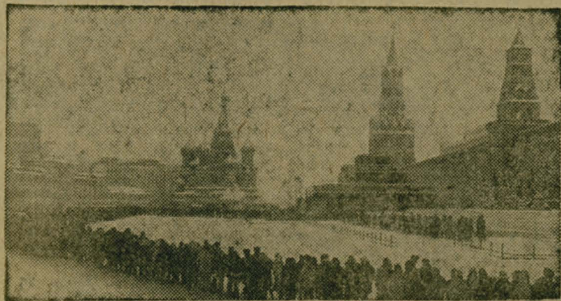
Москва. Красная площадь. Нескончаем поток людей к Мавзолею В. И. Ленина.