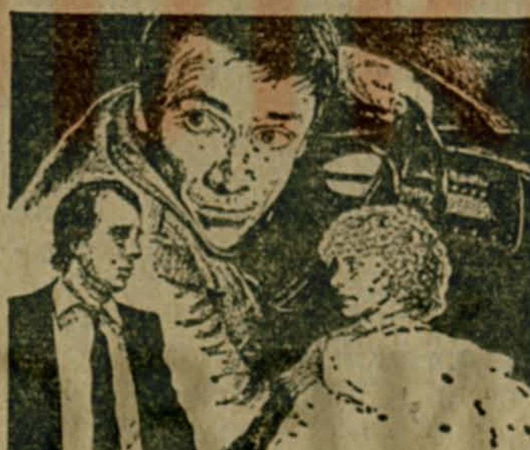
МИЛЫЙ, ДОРОГОЙ. ЛЮБИМЫЙ, ЕДИНСТВЕННЫЙ.

...Она бежала по заснеженной ленинградской улице, прижимая к груди завернутого в одеяло грудного ребенка и слышала за спиной топот каблуков, истошные крики: «Держите ее, держите!» Так начинается новый фильм Динары Асановой «Милый, дорогой, любимый, единственный...», созданный на «Ленфильме».