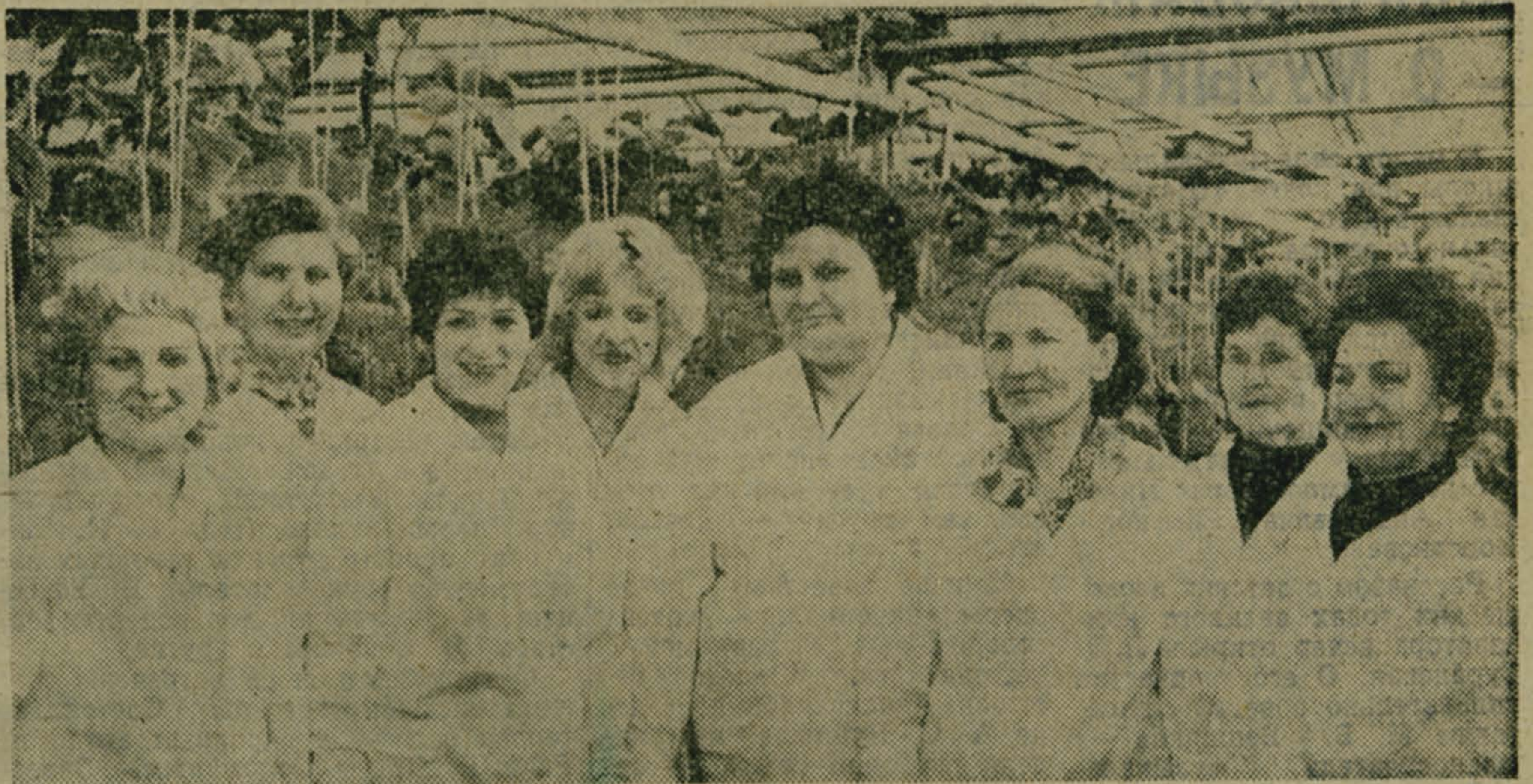
Замечательными успехами встречаются Первомай овощеводы нашего района. На их счету с начала года 9097 тонн ранних овощей при задании 7696.