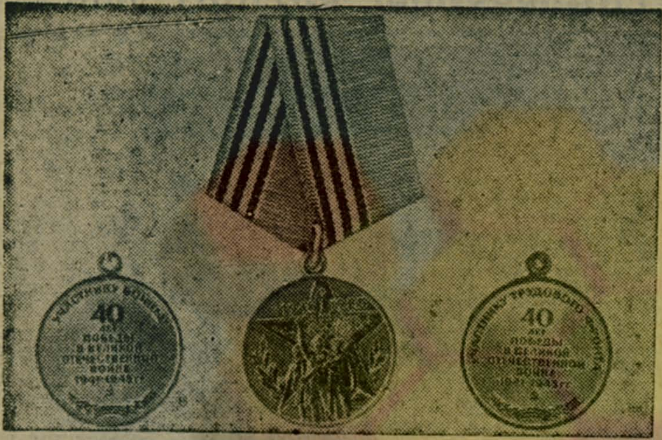
Юбилейная медаль «Сорок лет Победы в Великой Отечественной войне 1941—1945 гг.».