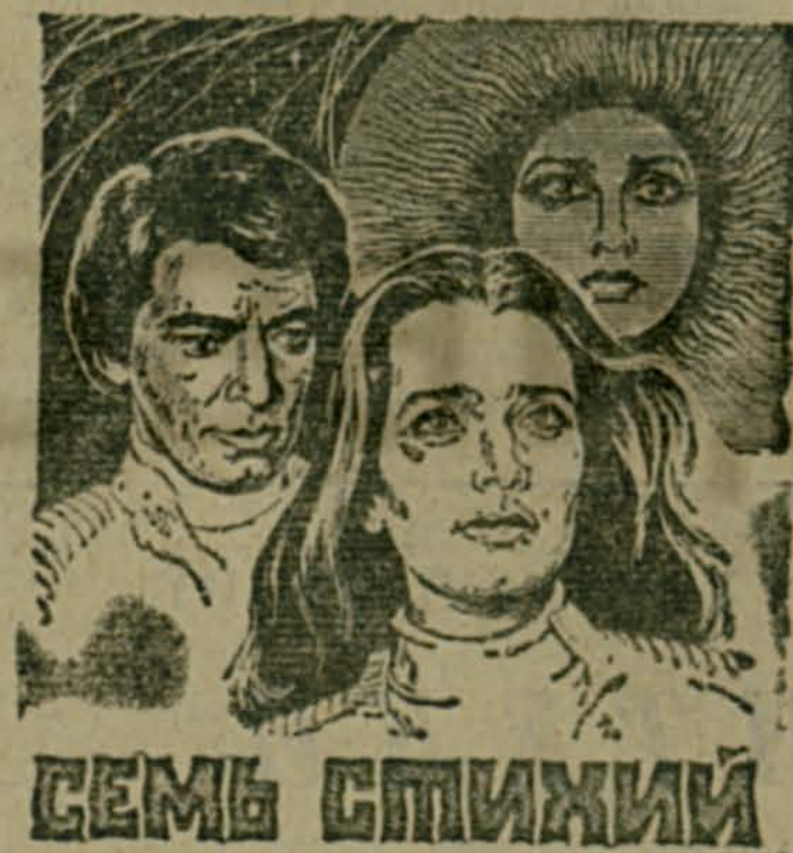
Скоро выйдет на экраны района новый фильм «Семь стихий».

ти. 6. Выставка. 8. Призма. 10. Сказка. 13. Акула. 14. Камен. 15. «Тайна». 16. «Салют». 19. Дегтярев. 20. Нансен. 22. Курсив. 23. Нотариус. 25. Рангоут. 26. Нотисин. 28. Лидер. 30. Атака.