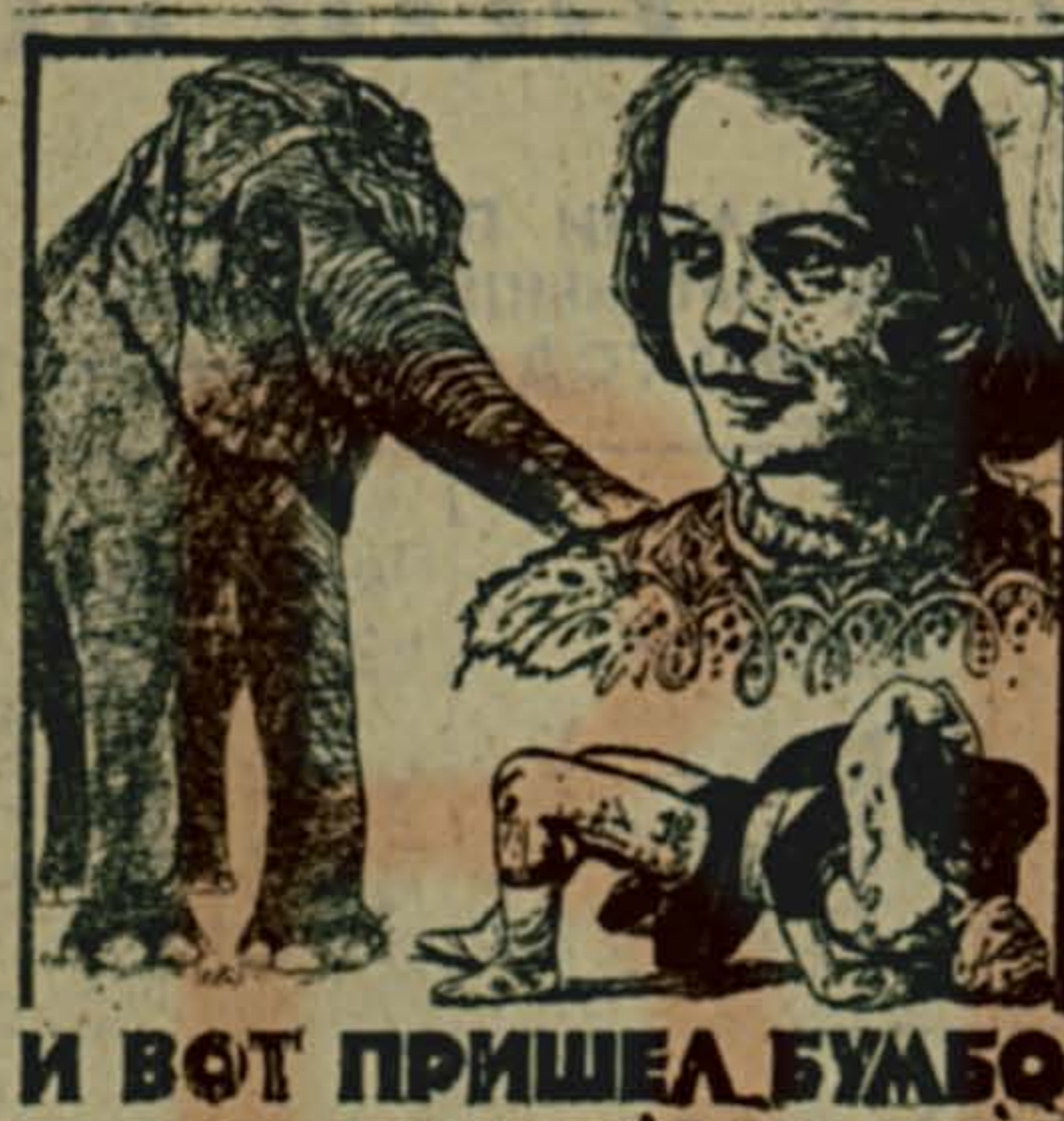
И ВОТ ПРИШЕЛ БУМБО

Эта притча о целительной силе доброты — очередная работа признанного мастера детского сказочного кино Надежды Кошеваровой.