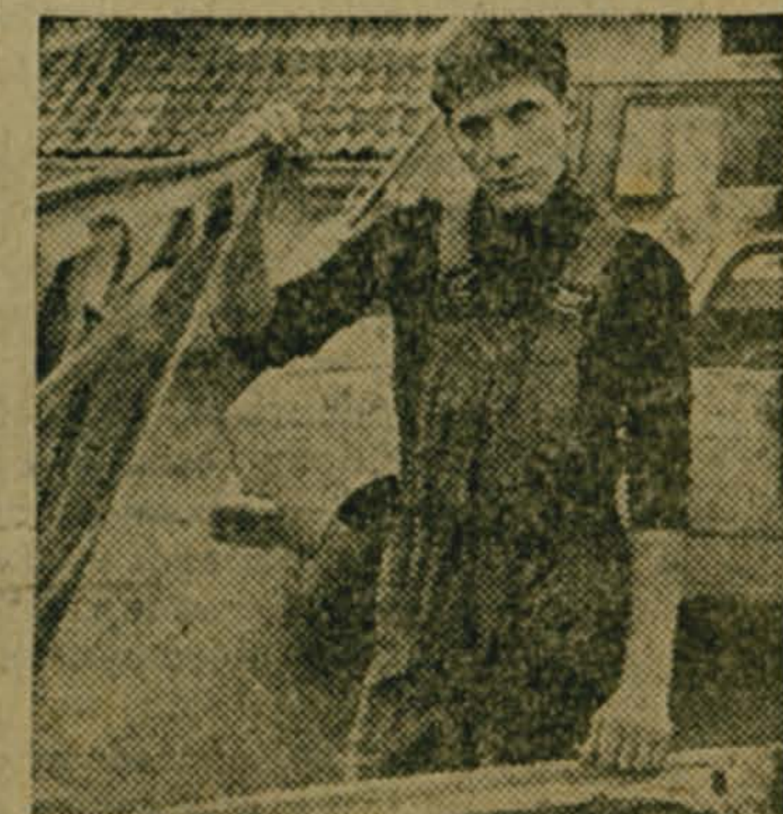
Эстонская ССР. Таллинские модельеры разработали коллекцию рабочей одежды, которую предлагают основному предприятию легкой промышленности Эстонской ССР, работающим в этом году в условиях экономического эксперимента. Сшитая из отечественных тканей, эта одежда хорошо защищает от ветра и непогоды. Раскрой не стесняет движения. НА СНИМКЕ: такая одежда удобна и в саду, и в цехе.