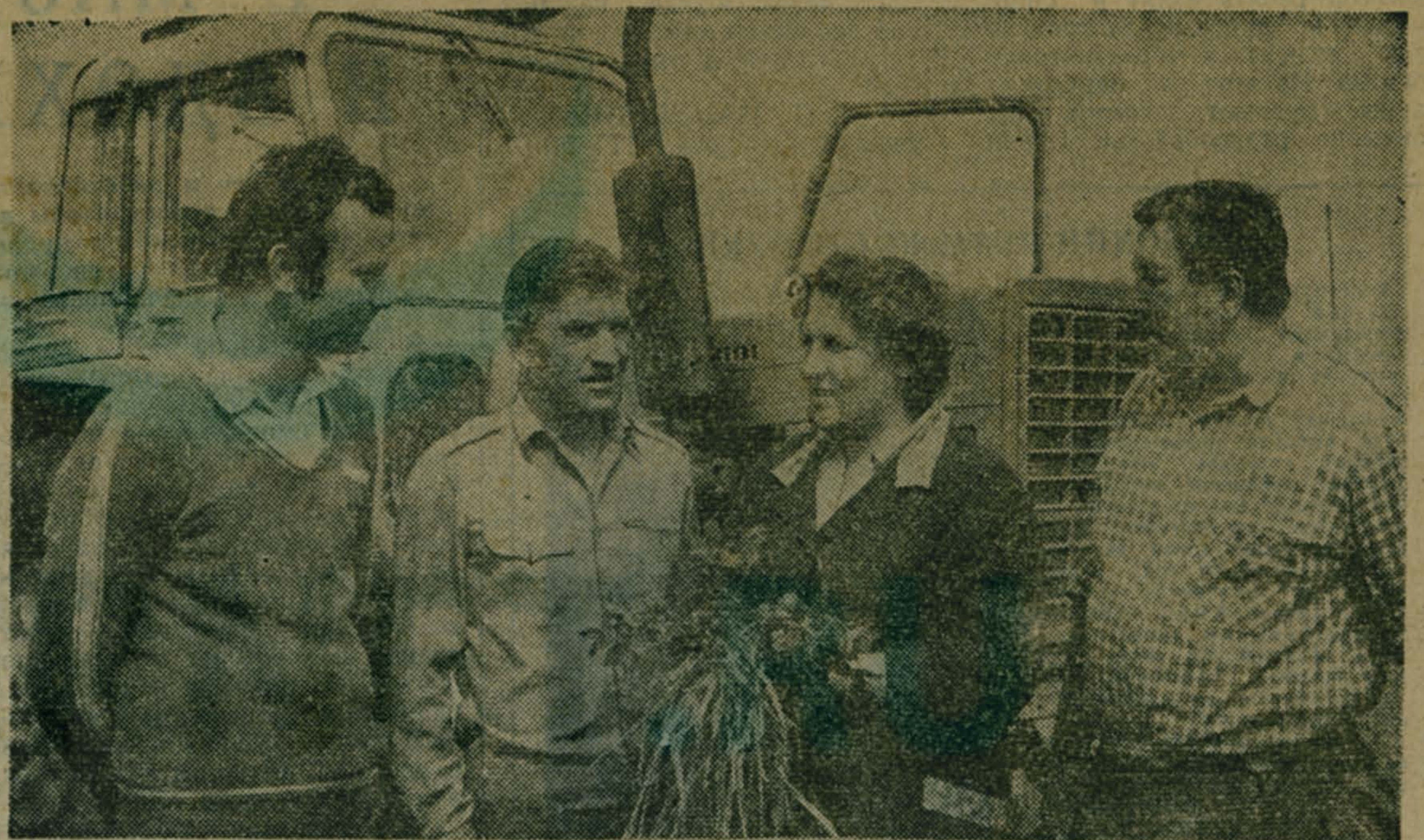
Умело владеют сеноуборочной техникой механизаторы опытно-производственного хозяйства «Коренево». Сегодня на лугах работают косилки, ворошилки, грабли, подборщики.

Редакция надеется, что все указанные руководители пришлют ответы по существу вопросов.