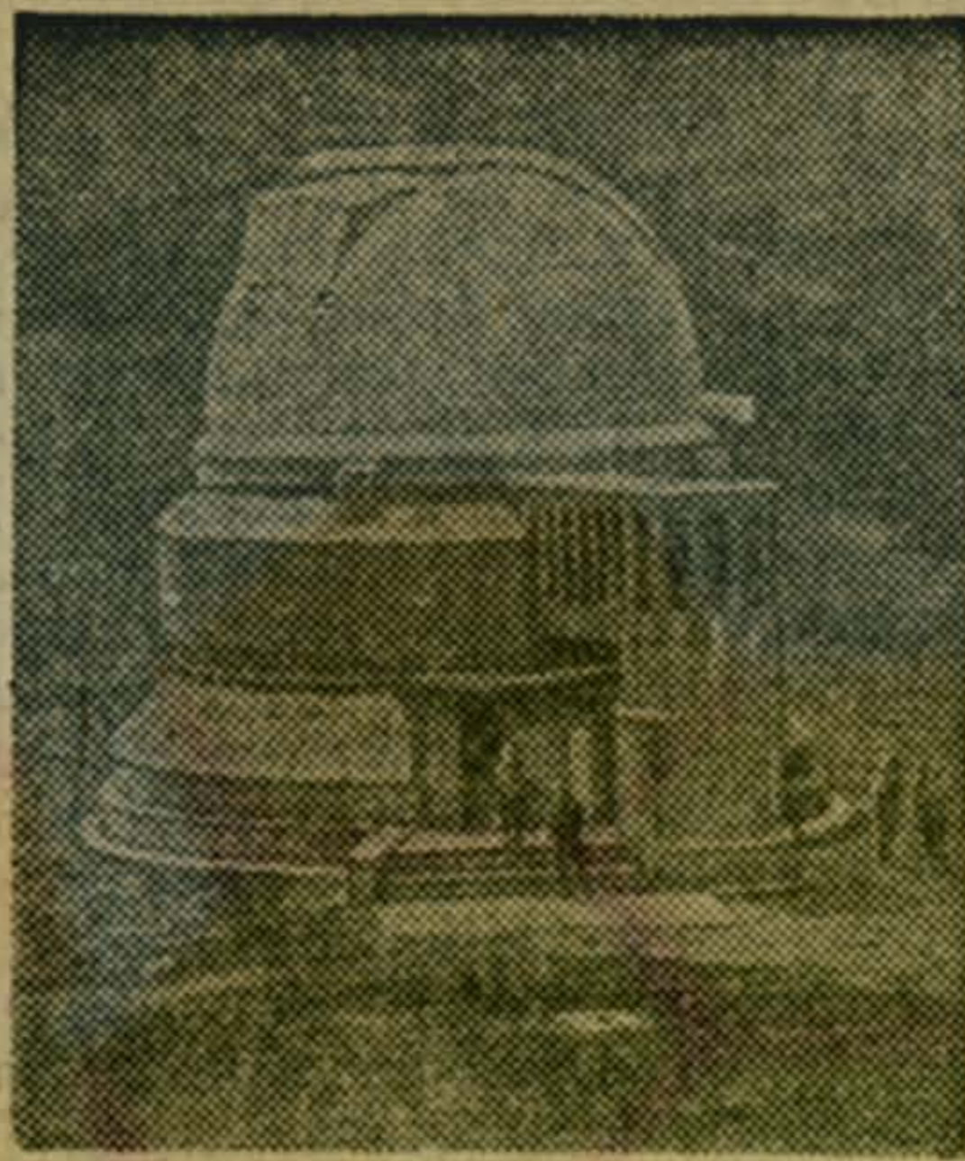
ратить расходы топлива.

Наблюдения здесь ведутся по широкой международной программе. Этот крупнейший астрофизический комплекс продолжает строиться. На высоте 2750 метров над уровнем моря сооружается здание под новый полутораметровый зеркальный телескоп, рабочие помещения и лаборатории, гостиница, монтируется система гелиотеплоснабжения, которая позволит на сорок процентов сок-