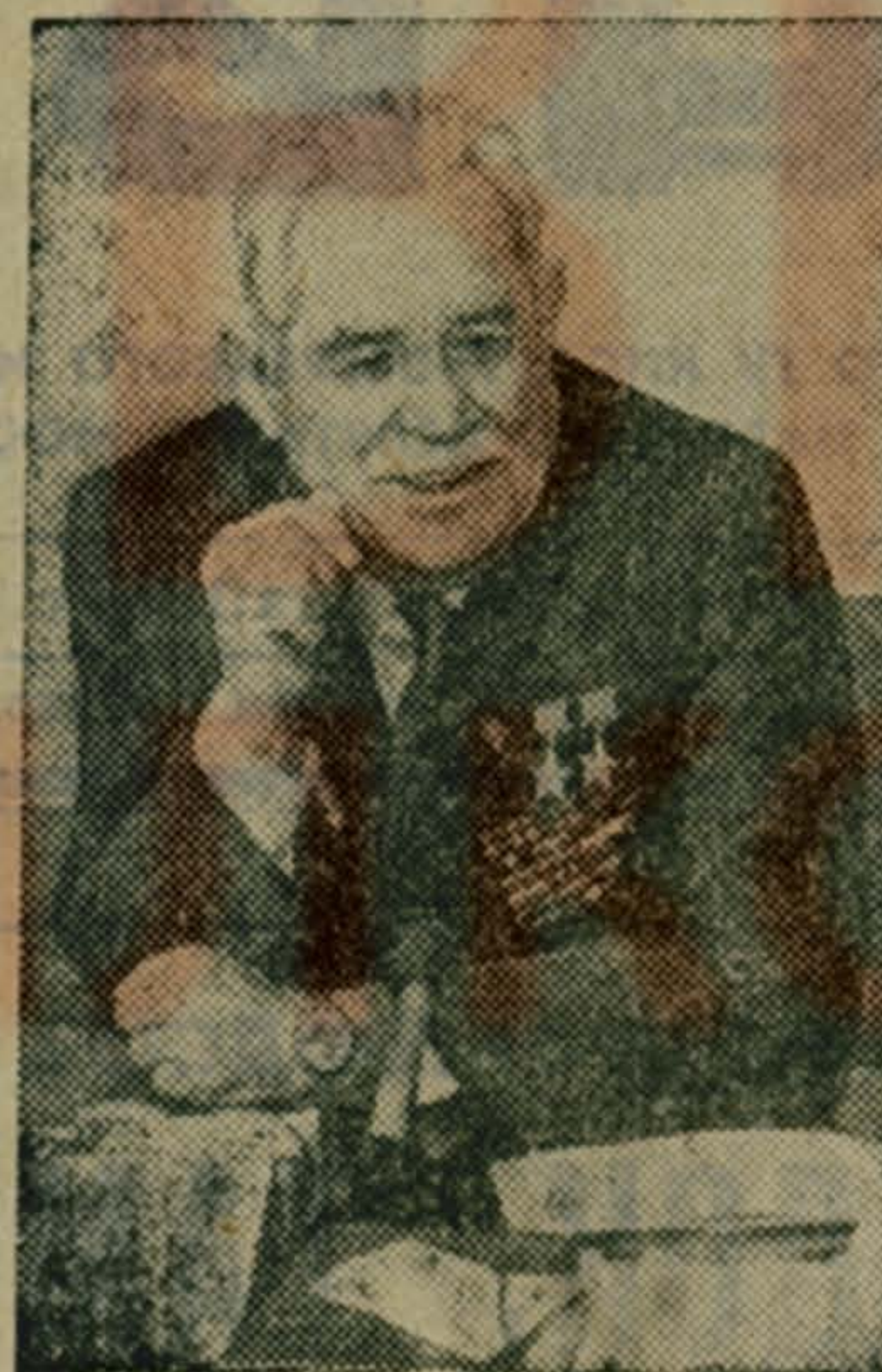
Киев. Дважды в годы Вели- кой Отечественной войны Алексей Федорович Федоров был удостоен высокого звания Героя Советского Союза. Этими высокими наградами секретарь подпольного Черни- говского обкома партии, ле- гендарный партизан, извест- ный врагам как генерал Ор- ленко, был отмечен за образ- цовое выполнение боевых за- даний командования в борьбе против немецко-фашистских захватчиков в тылу противни- ка, проявленные при этом отва- гу и героизм и особые за-

слуги в развитии партизанско- го движения на Украине.