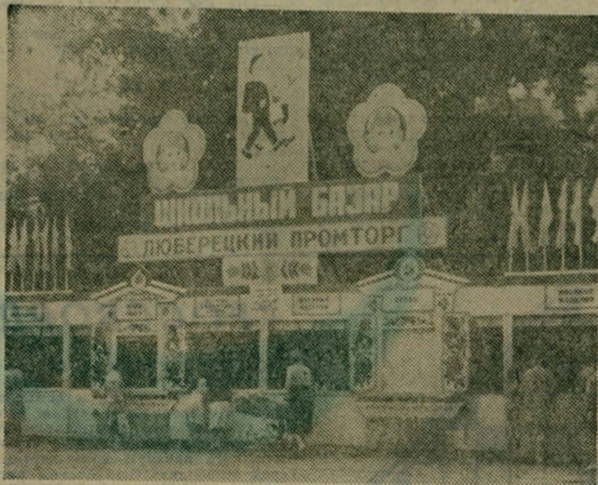
Сказочными теремами раскинулись неподалеку от Дома пионеров в канун учебного года торговые палатки.