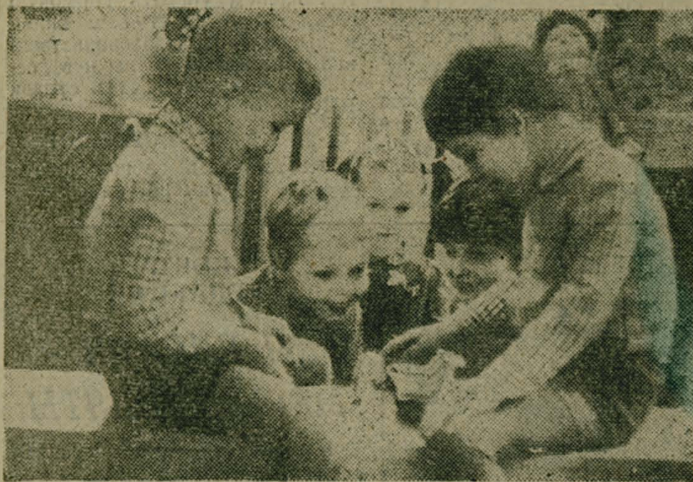
Ребята на снимке увлеклись интересным делом. Кто они? Будущие педагоги, строители, инженеры. Пусть же они вырастут здоровыми и крепкими, никогда не узнают ужасов войны. Сохранить мир на земле — нет сейчас задачи важнее!