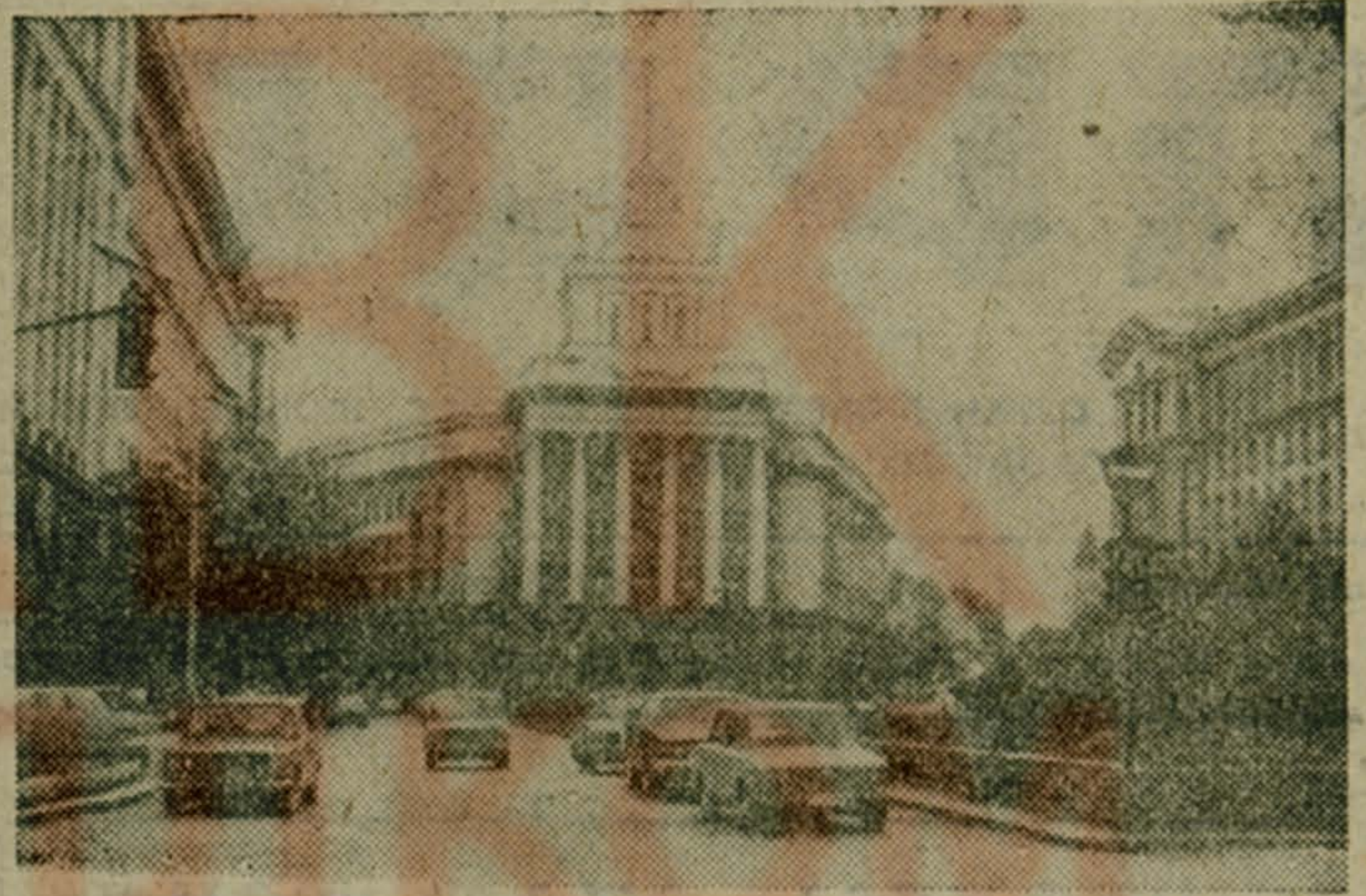
Новая жизнь Софии — столицы Народной Республики Болгарии началась после 9 сентября 1944 года — даты, которая навечно вписана в летопись боевого братства и дружбы между болгарским и советским народами.

9 сентября (1944 г.) — социалистическая революция в Болгарии. День свободы — национальный праздник Народной Республики Болгарии.