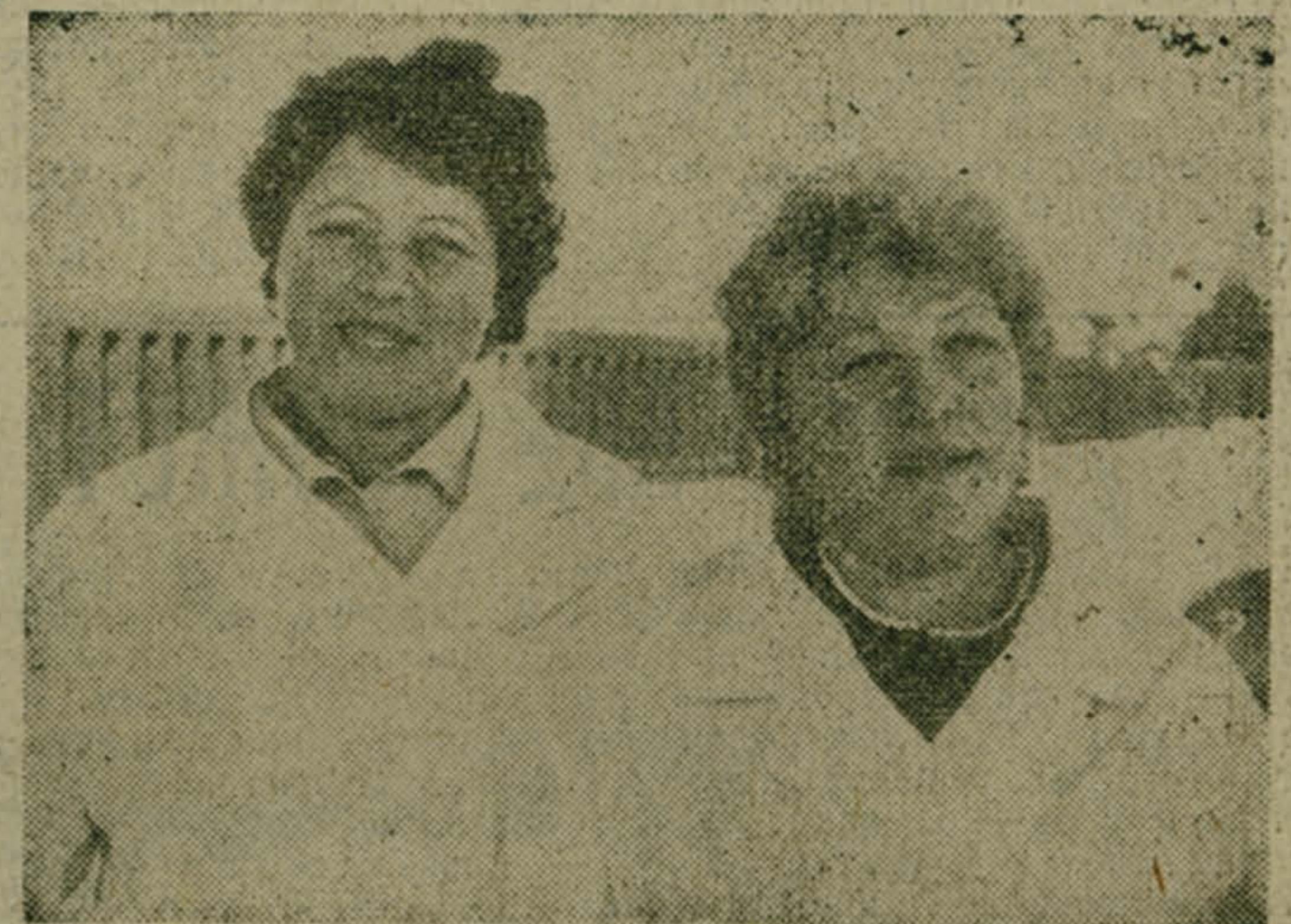
Животноводы племсовхоза «Фоминское» план восьми месяцев по продаже государству молока перевыполнили более чем на 300 тонн, а на днях они справились с девятимесячным заданием.

В предстоящую зимовку хозяйство вступает всесторонне подготовленным. В достатке кормов, отремонтированы скотные дворы. В части помещений проведена замена технологического оборудования, что поможет значительно увеличить производство молока и механизировать важные трудовые операции.