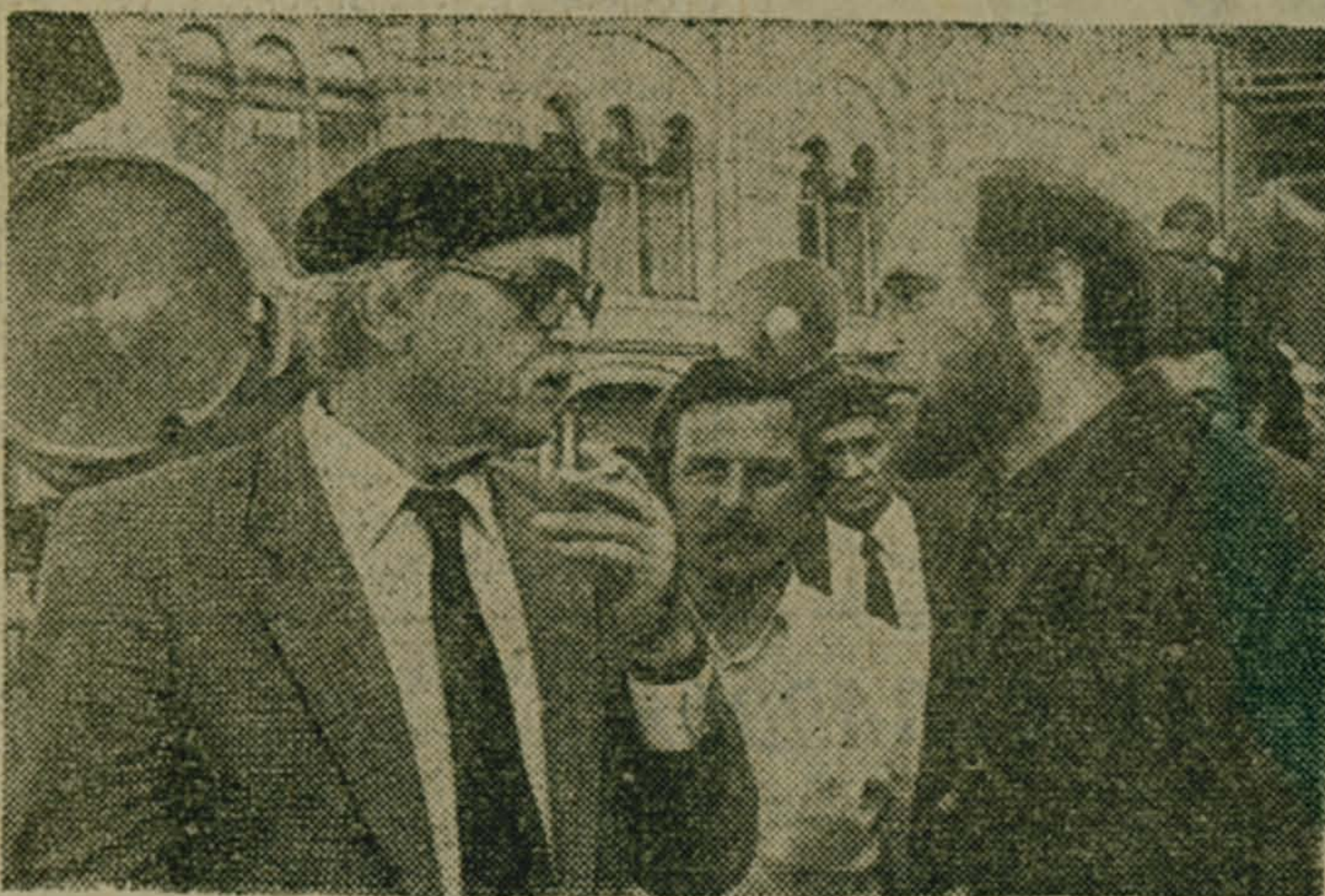
Москва. На киностудии «Мосфильм» идут съемки двухсерийного цветного фильма «Борис Годунов» — экранизация бесмертной трагедии А. С. Пушкина.

Съемочную группу возглавляет народный артист СССР, лауреат Ленинской и Государственной премии СССР, Герой Социалистического Труда Сергей Бондарчук. Главный оператор фильма — лауреат Ленинской и Государственной премии В. И. Юсов, главный художник — В. С. Аронин.