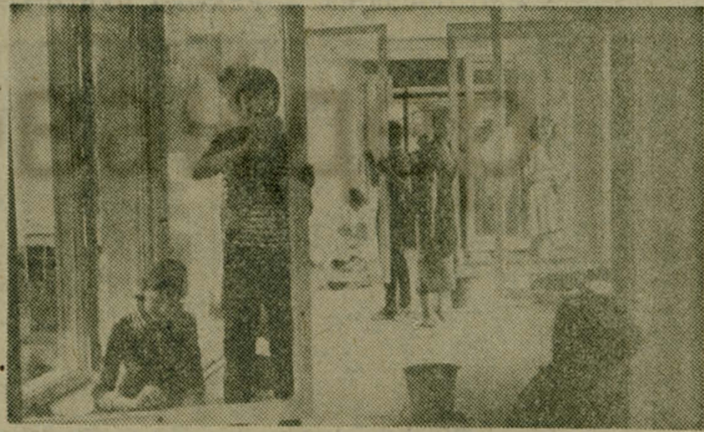
Этот снимок был сделан в конце августа. Учащиеся-старшеклассники новой люберецкой школы № 44 мыли окна. И сейчас еще немало дел по оборудованию кабинетов, мастер-

ских. Ими также занимаются ученики. Да иначе и быть не может. Кому, как не им, хозяевам нового дворца знаний, осваивать его.