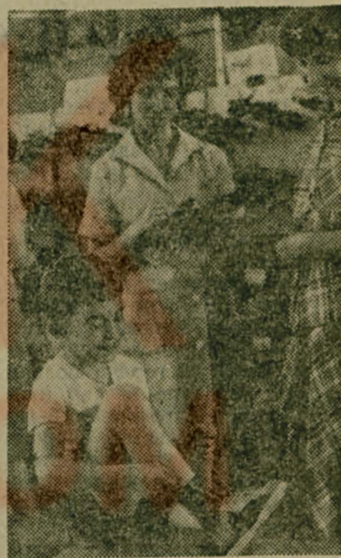
БЕЛОРУССКАЯ ССР. Коллектив Могилевской опытно-экспериментальной обувной фабрики имени 60-летия СССР с начала пятилетки изготовил сверх плана изделий на три с половиной миллиона рублей. При этом 100 процентов продукции реализовано. Покупатели уже давно по достоинству оценили сделанные со вкусом туфельки, кроссовки, сапожки, выпускаемые предприятием.