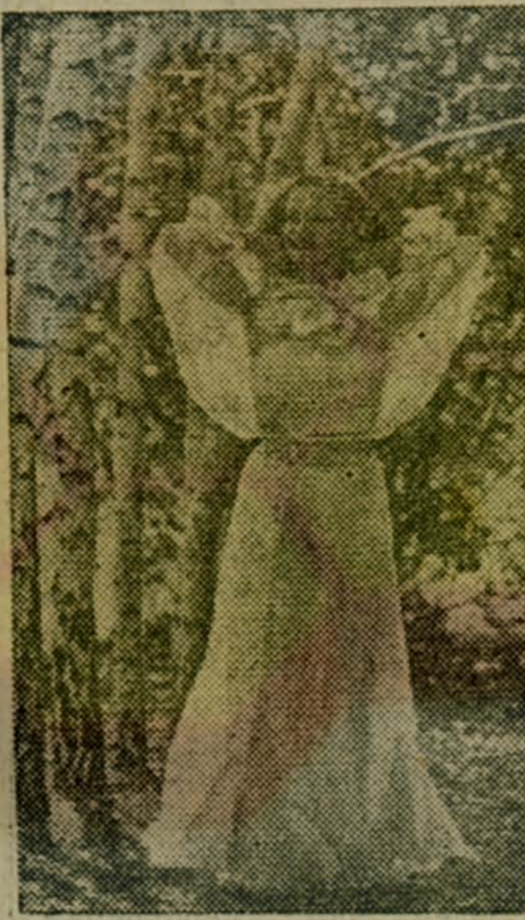
НА СНИМКЕ: лауреат премии Ленинского комсомола, многих международных конкурсов народная артистка Украинской и Молдавской ССР С. Ротару.

Маршруты встреч-концертов певицы пролегли через всю страну. С каждым годом ее творческая палитра, где органично переплелись русские, украинские, молдавские напевы, становится ярче и выразительнее. Высоким гражданским пафосом, лиричностью и глубоким содержанием наполнены произведения последних лет. «Родина моя», «Дадим шар земной детям», «Не могу забыть», «Аист на крыше» звучат как маленькие драматические новеллы о мире, дружбе, любви. За концертные программы 1983-84 годов София Ротару представлена на соискание Государственной премии СССР.