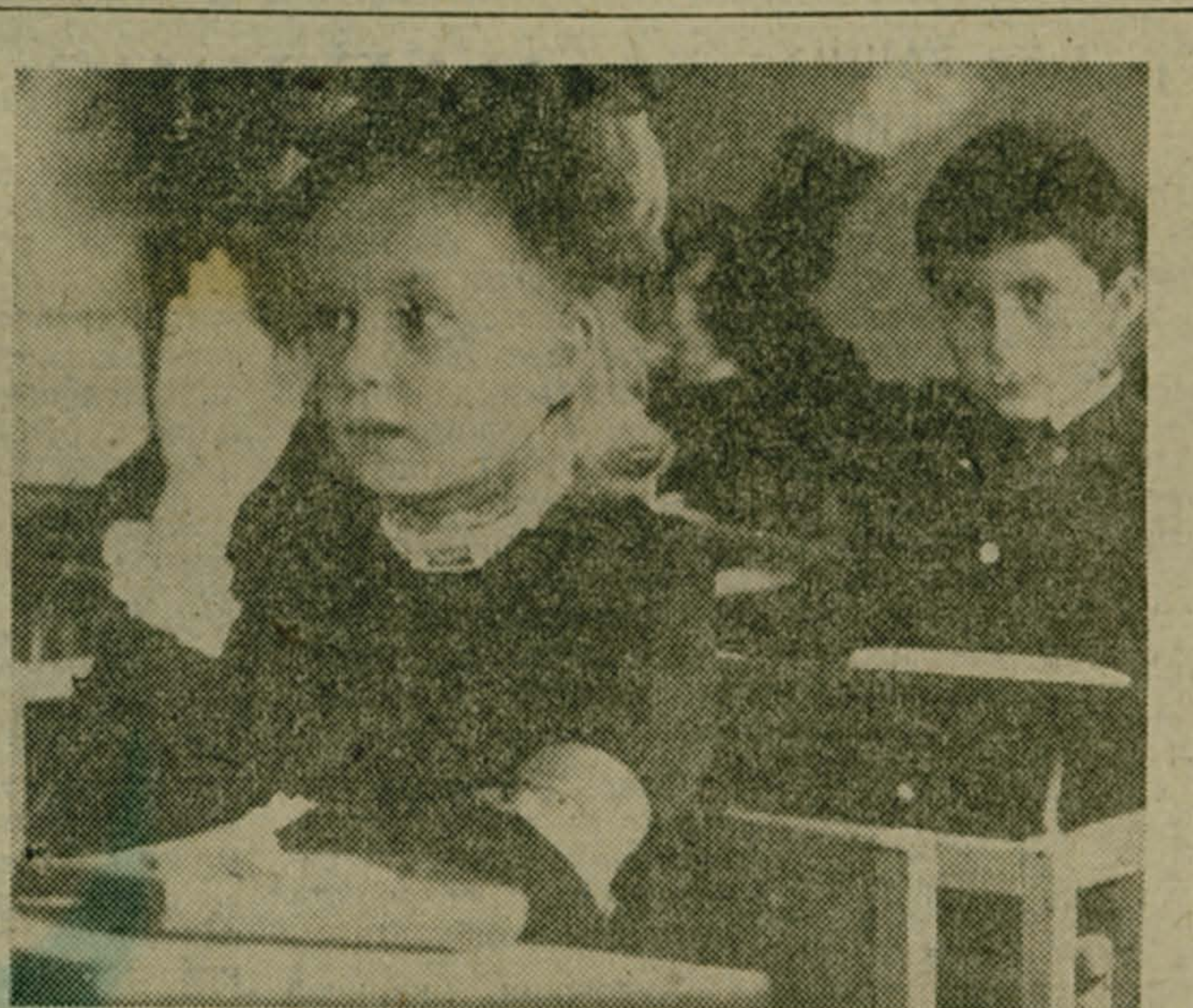
Шаги школьной реформы в нашем районе отмечены дальнейшим совершенствованием учебно-воспитательного процесса, соединением обучения с производительным трудом. Ну и вновь за парты сели шестилетние ученики. Нынче впервые взялись за это ответственное дело педагогические коллективы школ №№ 18 и 41.