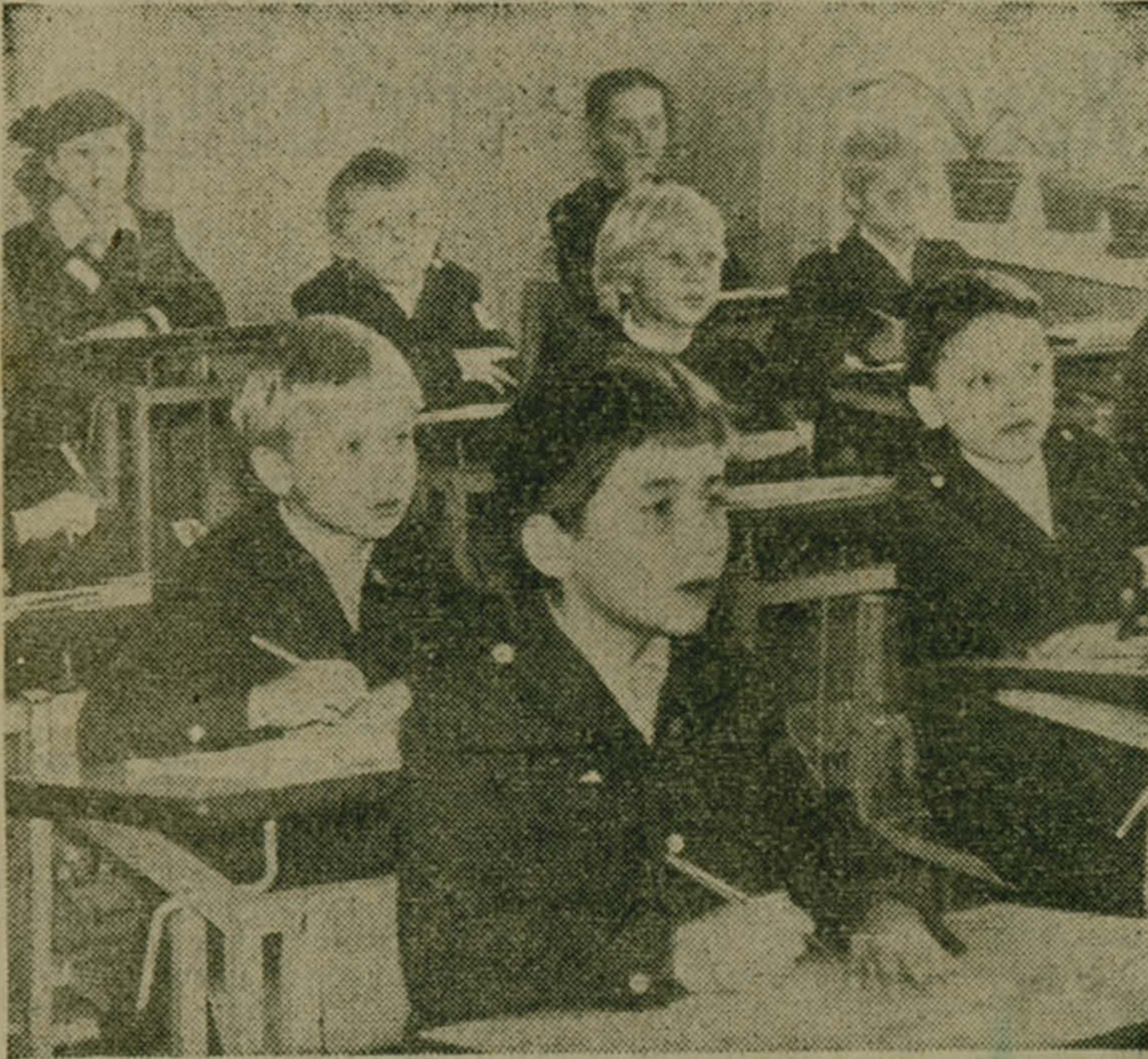
Позади День знаний с его цветами, белыми фартуками. На календаре — уже конец октября. Для всех, в том числе и самых юных учеников начались трудовые будни.