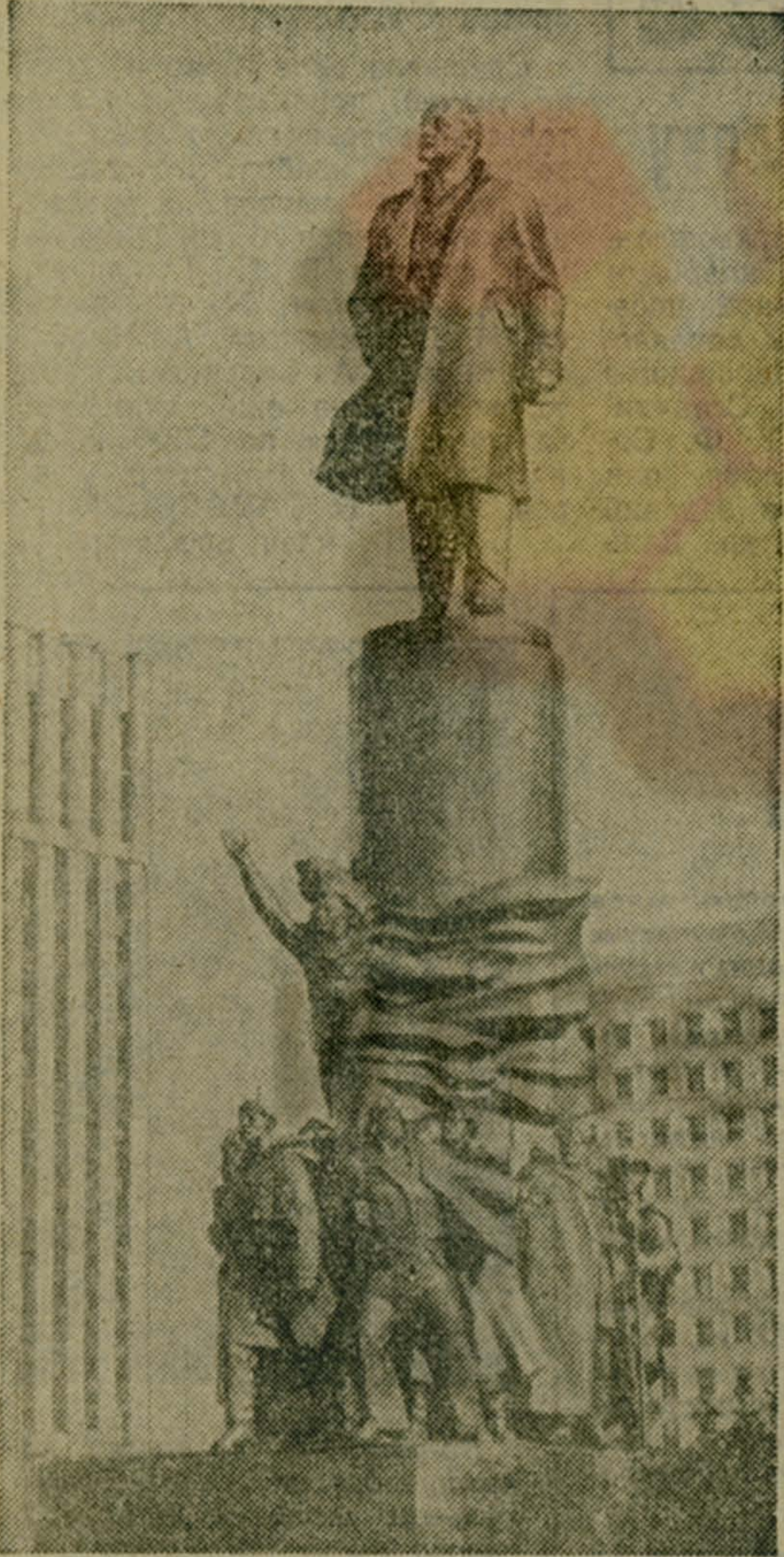
Москва. На Октябрьской площади столицы открыт памятник В. И. Ленину. Памятник представляет собой фигуру великого вождя пролетариата, стоящую на высоком постаменте, и многофигурную (14 скульптур) бронзовую композицию, изображающую участников Великой Октябрьской социалистической революции.

Авторы памятника — Герой Социалистического Труда Л. Кербель и В. Федоров.