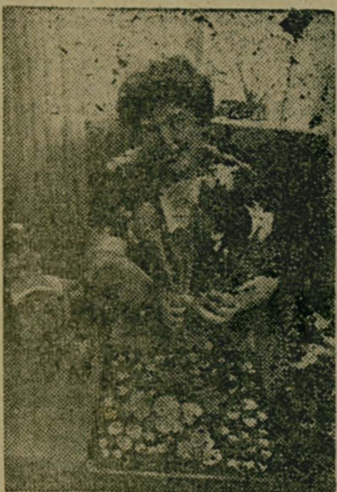
ГОРЬКОВСКАЯ ОБЛАСТЬ. Издана село Пурех Чкаловского