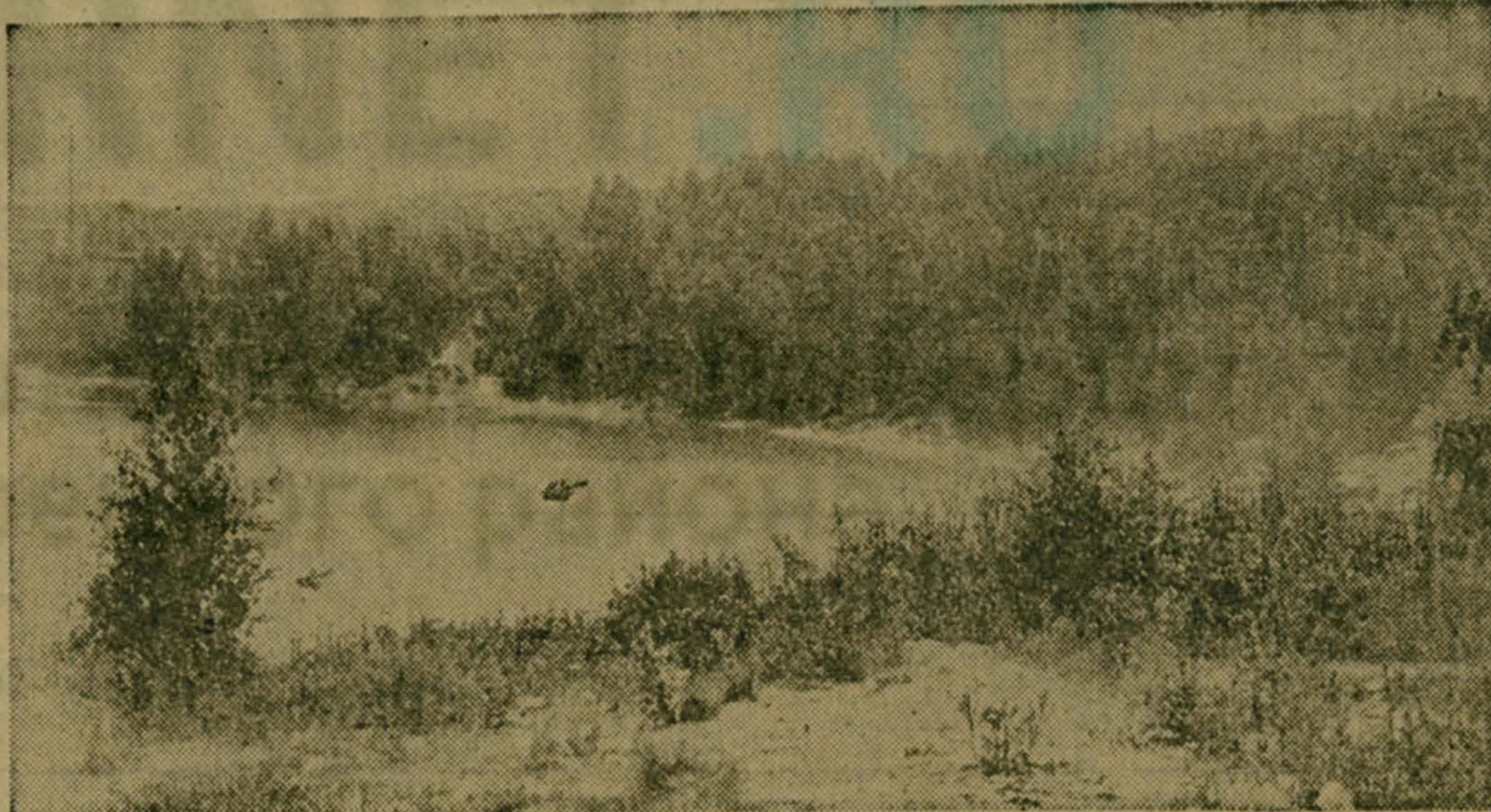
Хорошо отдохнуть на карьере!

Публикацию подготовили: Л. ЛЕТАЙКИНА, заведующая Томилинской библиотекой. В. ПОПОВ.