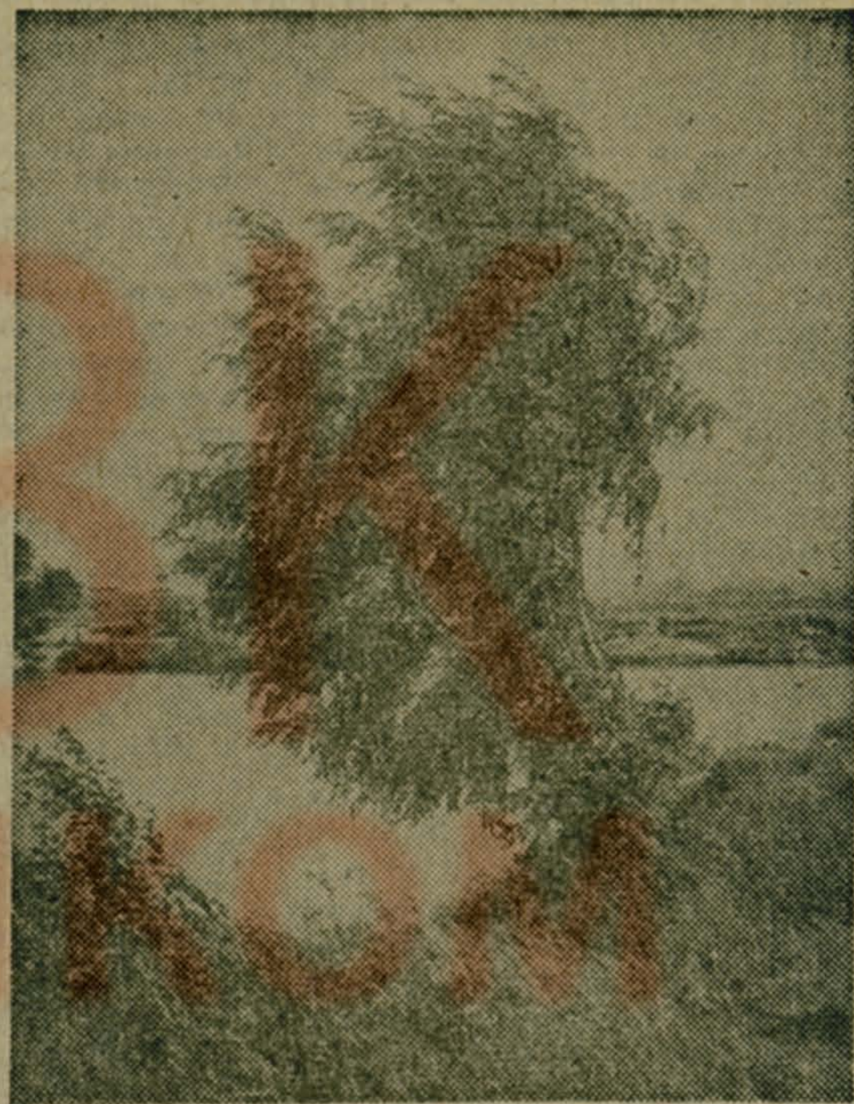
На крутом берегу.