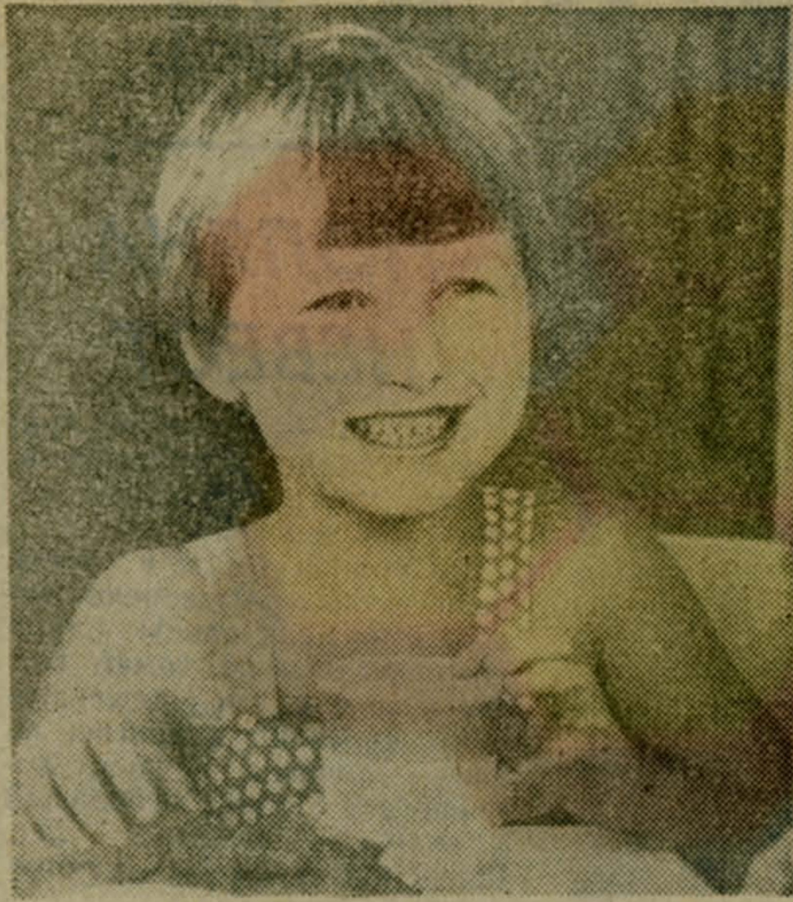
Т. ПРОНКИНА. «Хорошее настроение»

«ЗДРАВСТВУЙ, ШКОЛА!» — под таким девизом в Люберцах проходил праздник, предшествовавший новому учебному году. В пятницу в городском Дворце культуры открылась большая выставка фоторабот и фоторепортажей, рассказывающая о том, какими интересами живут учащиеся, чем увлекаются, как помогают старшим товарищам в выполнении производственной программы.