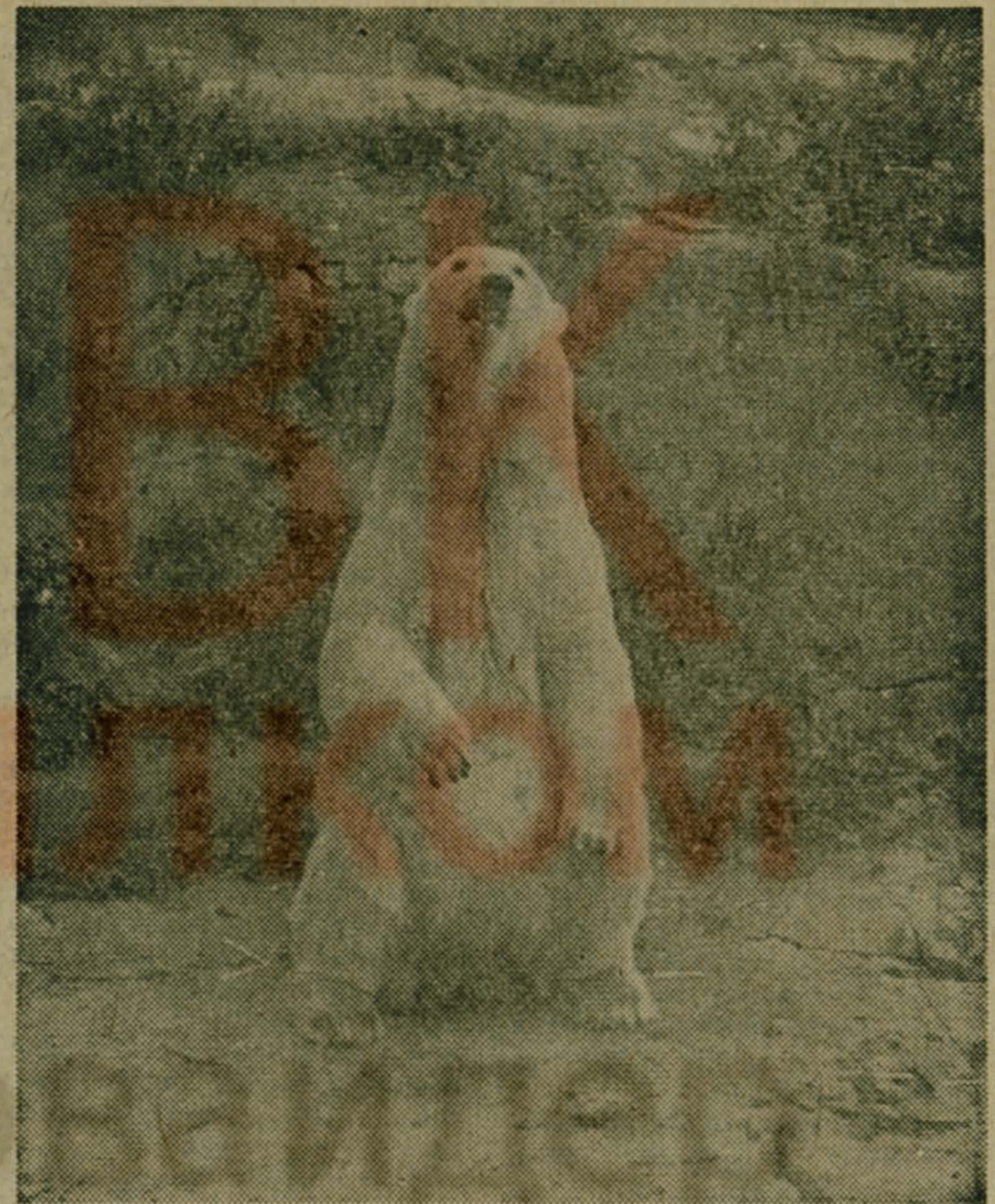
«МОГУ И СТАНЦЕВАТЬ»