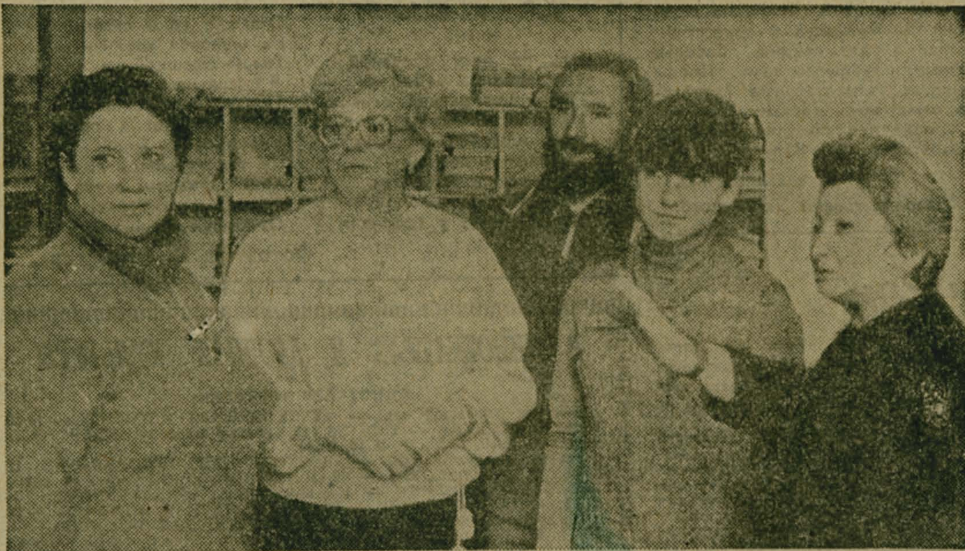
Люди, которых вы видите на снимке, — не просто коллеги, члены одного педагогического коллектива томилинской средней школы № 14. Их связывает большее — все они в разное время окончили эту школу, а потом с учительскими дипломами вернулись сюда, в родные стены, чтобы самим учить детей.