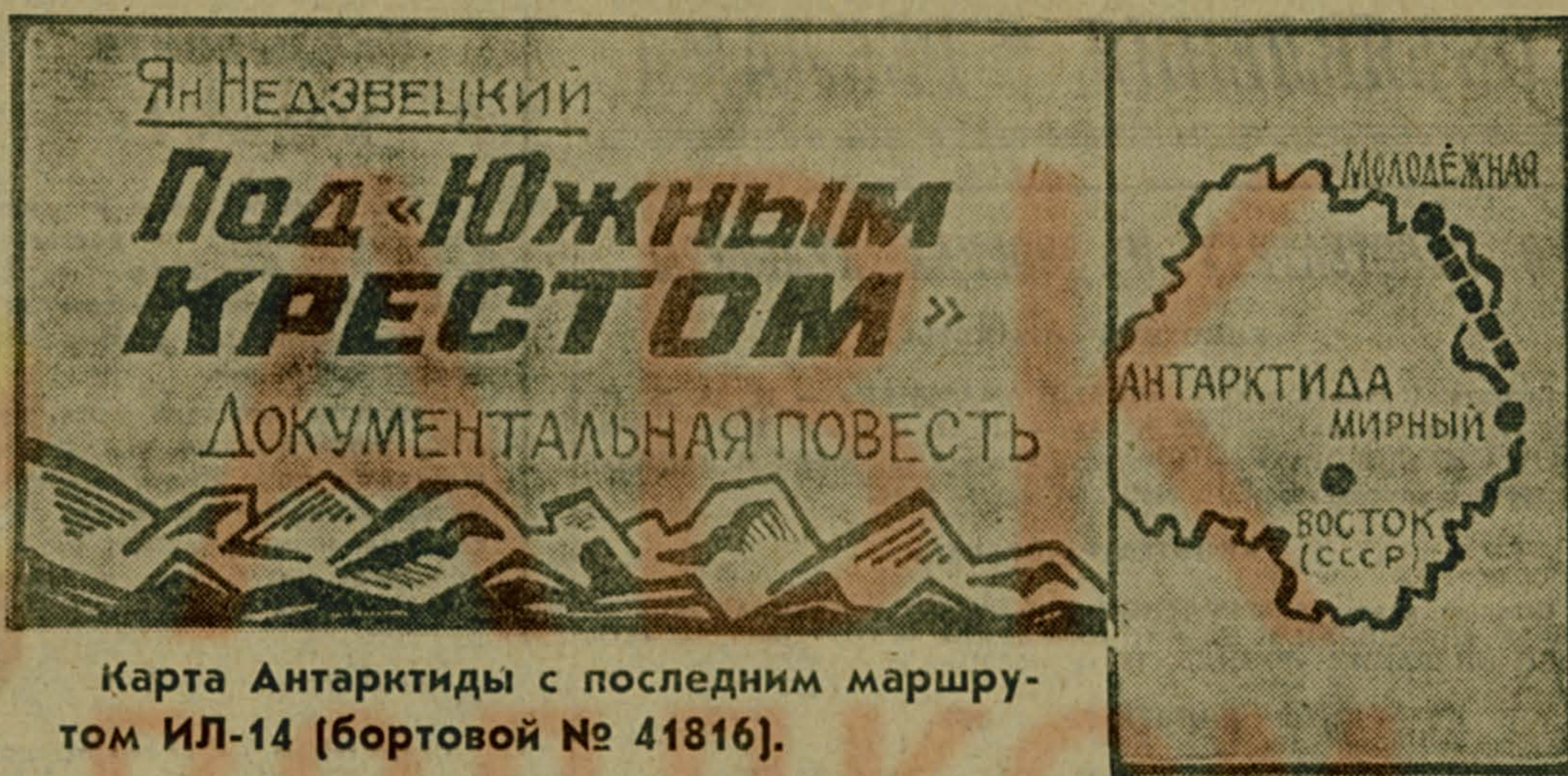
Карта Антарктиды с последним маршрутом ИЛ-14 (бортовой № 41816).