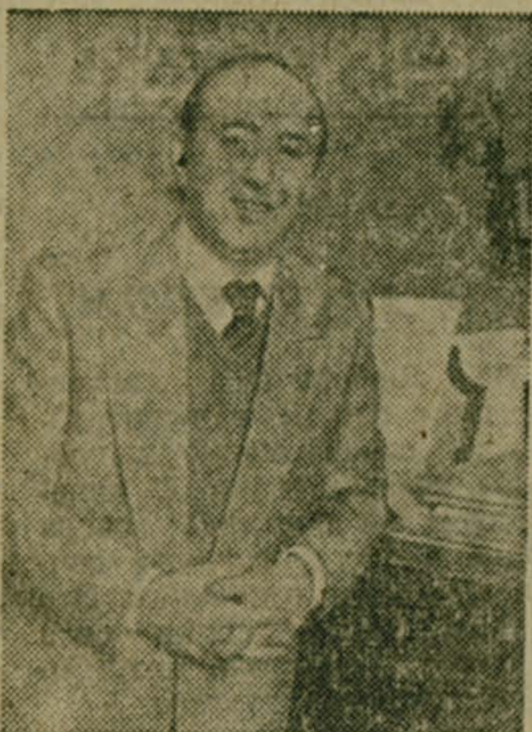
МОСКВА. Народному артисту РСФСР Владимиру Всеволодовичу Крайневу за концертные программы 1983—1985 годов присуждена Государственная премия СССР 1986 года. На снимке: солист Московской государственной филармонии В. Крайнев.