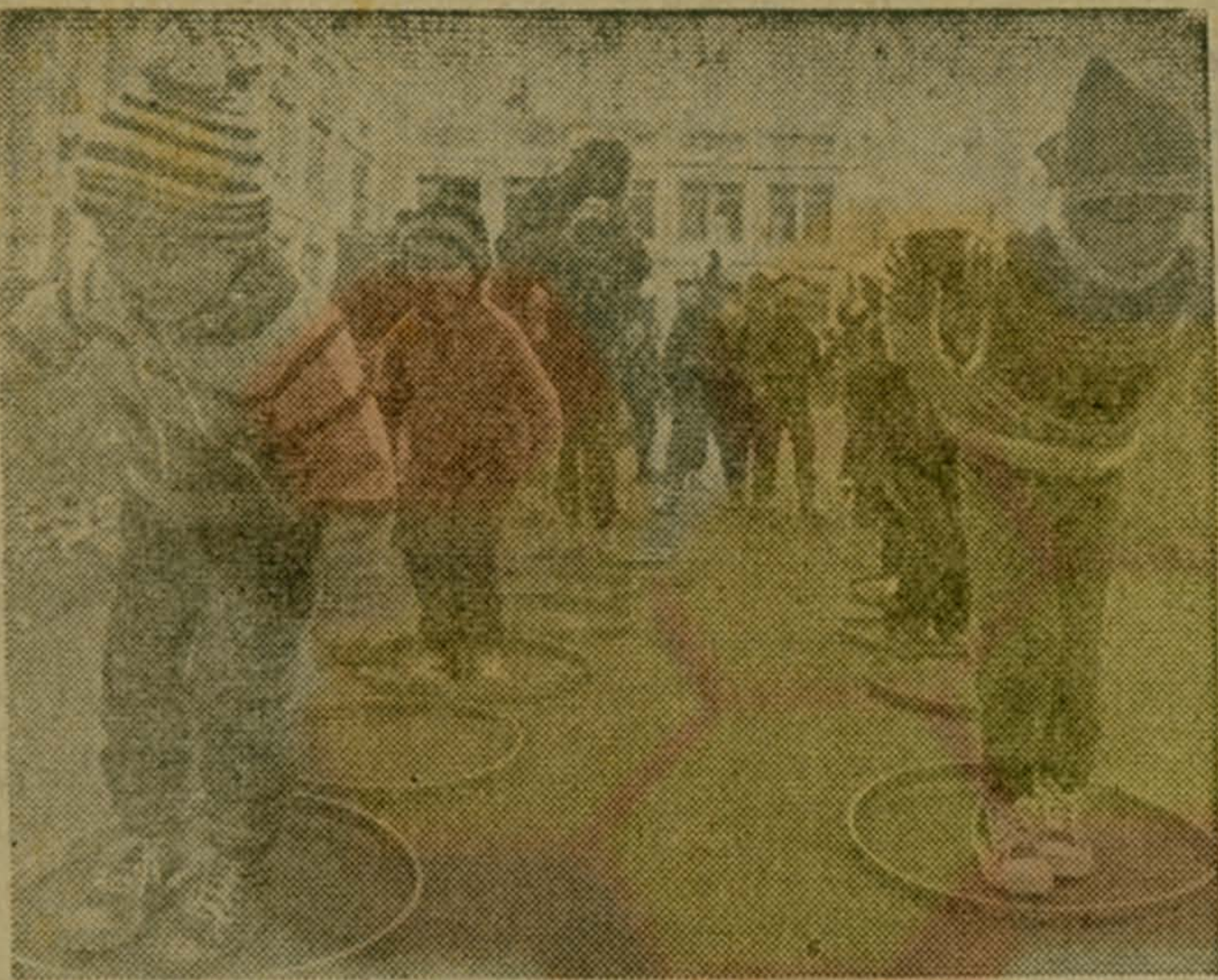
МОСКВА. Почти на 25 процентов снизилась заболеваемость ребятшек, посещающих ясли-сад № 753 Перовского района столицы. Работники этого детского учреждения считают, что главный «виновник» — физкультура. На снимке: прыжки в цель.